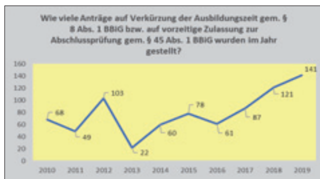
(Entwicklung 2010 – 2019)

e) Im Jahr 2019 wurden (in allen drei Ausbildungsjahren) insgesamt 141 Anträge auf Verkürzung (2018: 121) der Ausbildungszeit gem. § 8 Abs. 1 BBiG bzw. auf vorzeitige Zulassung zur Abschlussprüfung gem. § 45 Abs. 1 BBiG gestellt.