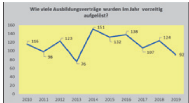
(Entwicklung 2010 – 2019)

b) Vorzeitig aufgelöst wurden im Jahr 2019 (in allen drei Ausbildungsjahren) insgesamt 92 Verträge (2018: 124).